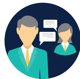
Stručna potpora i organiziranje projekata