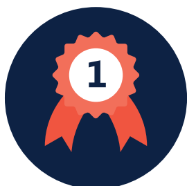
Posebna nagrada Povjerenstva