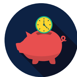
Ulaganje u studentske udruge i projekte